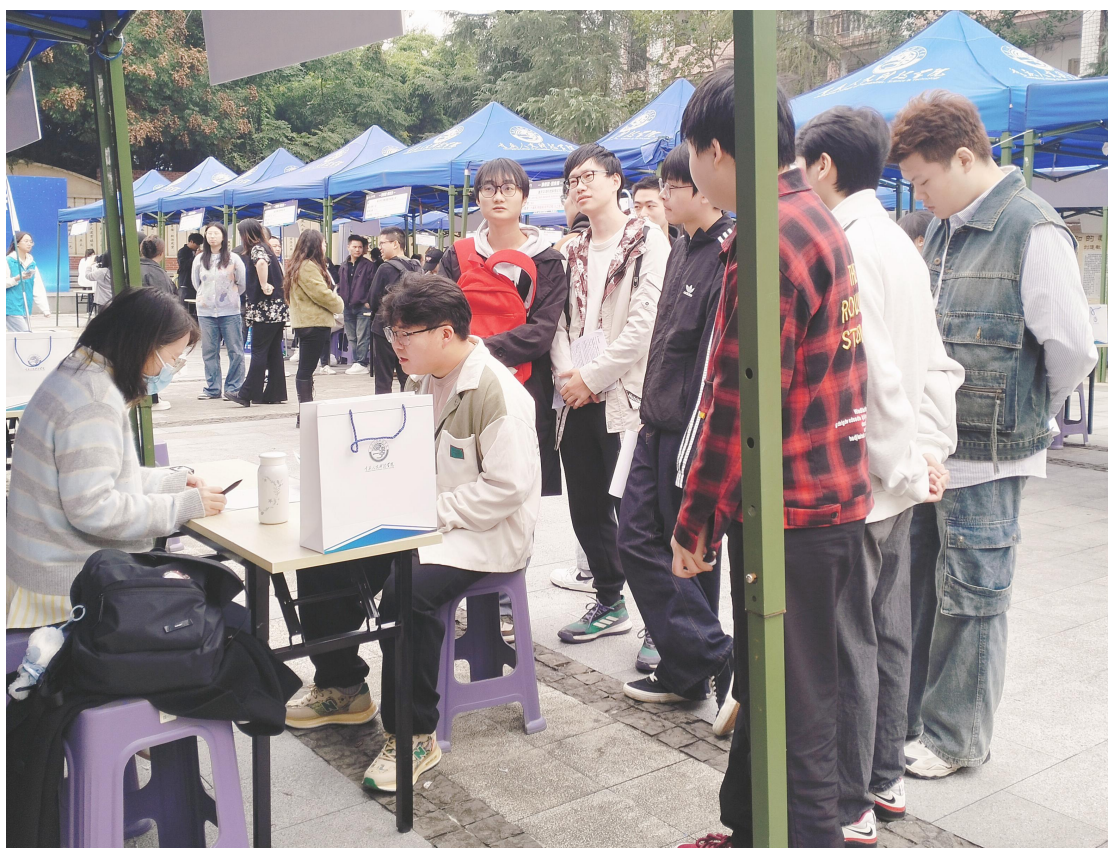
本次双选会是学院落实“就业导向、校企协同”人才培养模式的